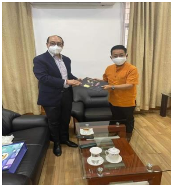
མཇུག་ཏུ་གྲོ་བོ་དཔྱད་སྟེགས་ལ་བཞུགས་པའི་ཚོས་ ༩

སྐྱོ་གར་ ལྷོ་མེད་ གཤམ་གཤམ་ ལས་ཁུངས་ཀྱི་ དུང་ཡིག་ རྒྱ་ཞབས་ ཏམ་ས་ འབར་དན་ སིང་རི་ལ་ འབྲས་རྩོད་ས་ གཟུགས་རྩོད་ལོ་ རྩོན་པོ་ སྤང་། རོང་གི་ སོང་མཁན་ དཔྱད་སྟེགས་ བཞུགས་པའི་ ཚོས་ ༩ རྒྱུ་ཚེ་ གཙོ་རྒྱ་ རྩོན་པོ་ རྒྱ་ཞབས་ དེ་ཞེས་ ཏམ་ས་ ལོ་ མཇུག་པོ་ སྤང་། རྒྱ་ཞབས་ སང་རི་ལ་ གྱིས་ གངས་ཚེན་ མཚོད་ལ་ འགྲོ་ལེན་ རྩོ་རྩེ་ ལས་རིམ་ན་ ཡང་ རྒྱགས་འགན་ བཞུགས་པོ་ གནང་པོ་ སྤང་།