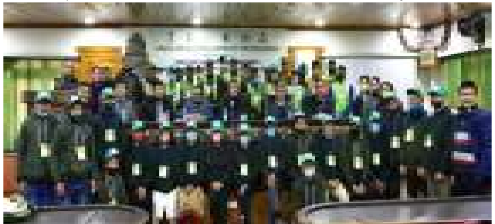
Green Skill Development Programme (GSDP) for 2021 session on four certificate courses viz Forest Fire Management, Bamboo Crafts, Beekeeping and Solar Energy Systems

सिक्कि सनकानया यागाया विरगयास यः यः आयाङ्कन याग सः। लाक सए हनवरः रग वल्ल सल मूय याद शया माग सः अल मन्नी यागाया विरग रग सकिग सनल नँ माग स, वयकारिनाय विरगया सविन रग पी० उन० (भया, मूय जीजीपी रग अघः सवदव अल विरगीय अधिकानी, धरु, यागाया सनाकारि अल अनया मनीय माग द।