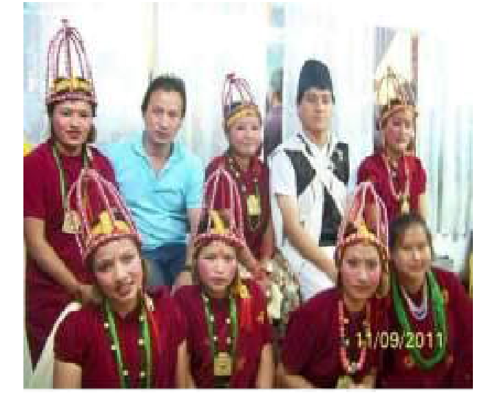
ইন্থি ক্রিয়ান ব্যব্য -ট্রিয়ান

बाँग्रैंक अधि हैक्देंप्षर coco- ছাইছ নাইম্মান হৌহাঁতি ই ইট্রিট ธุ้ ช देव 🛪 🔻 दे वैं किंदे दे रैं बर्रेर्तं इंष्ट्रेंडर क्रंदेंष्रं ২ঁকা⊼ুঁ আ ছুগ্র ম অর্হুমুশ্য দ্ৰেখ্য 🔻।। 🖫 আঁশ্ৰাভ্ৰম মুঠ इप्रदूर इंक्कं है बाबाजे ठित्वार द्<sup>र्ले</sup> विदेश खिंच र हिंब-সম্মা দেখা ঈ॥ মা মা ॾ॓क़क़ऺ॔ॸॕॸॼ॓॔ज़॓ <u> ট্র</u>আস य्राइंय र् थंय हैं वा अर्बा ណ៊ាំង एकिंग केंट एंट्रिजे. चं⊞ूं⊥ षाक्⊼श्र⊥ ञ्र⊼रकुँ५ ष्ट्रिंग ज्रा